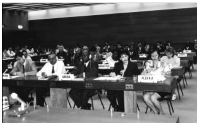
Fóto 2: Representantes de países en la reunión del Grupo consultivo del SIGADE

Al finalizar la reunión, la UNCTAD tenía un panorama mucho más claro de los nuevos retos y tareas que se le pre-