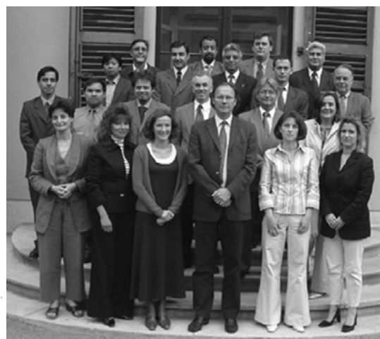
L'équipe centrale du SYGADE à Genève

Pour toute correspondance, veuillez vous adresser à :