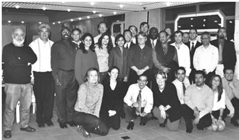
Participants aux ateliers sur la validation des données et la formation des formateurs, 4-15 novembre 2002, Genève, Suisse

À la suite de l'atelier sur la validation des données, les mêmes participants ont été invités à un deuxième atelier, du 11 au 15 novembre, consacré à la pédagogie et organisé par la section de la formation et du perfectionnement du personnel des Nations Unies. Travaillant avec des "coaches", les anciens et les nouveaux formateurs du SYGADE ont pu évaluer leurs compétences et techniques, échanger leurs réactions et prendre connaissance de toute une gamme de méthodes de formation complémentaires et nouvelles. L'atelier a étudié comment identifier les besoins réels de formation, évaluer le degré de compréhension des participants, améliorer les compétences en matière de présentation et de facilitation de groupe ainsi que la manière dont les adultes apprennent et communiquent (dynamique de groupe).