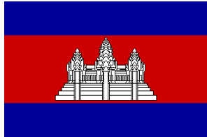
ກໍາປູເຈຍ