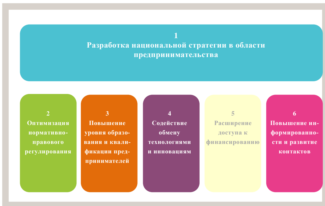
Диаграмма 1 Важнейшие компоненты разработанных ЮНКТАД рамочных основ политики в области предпринимательства