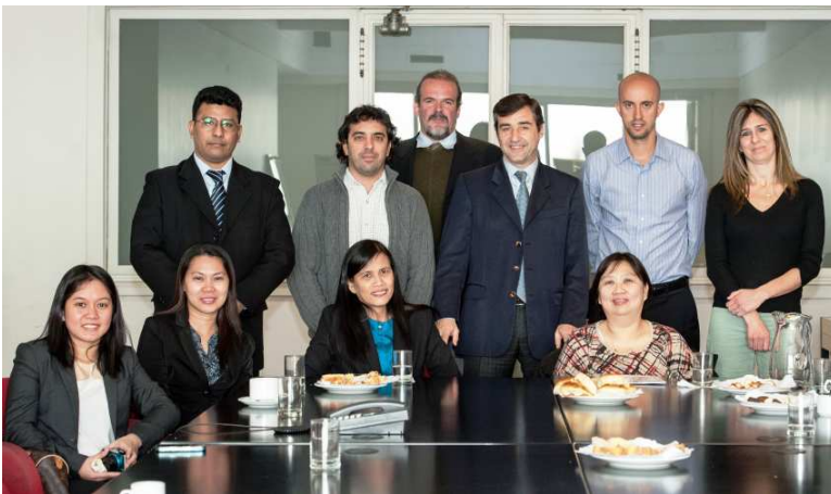
Délégation des Philippines en Argentine à l'occasion du voyage d'étude auprès de l'Oficina Nacional de Crédito Público

En 2010, le BTr et la CNUCED ont signé un projet d'assistance technique couvrant plusieurs grands domaines, notamment la réforme institutionnelle et organisationnelle, un grand plan de développement des capacités humaines, le renforcement des fonctions de gestion analytiques et des risques ainsi que la mise en œuvre du SYGADE 6 au sein du BTr. Le projet a débuté en mars 2011, et entre dans sa dernière année de mise en œuvre. Le projet est coordonné par un comité de pilotage qui comprend la Trésorière des Philippines, le Vice Trésorier et le Chef du Programme SYGADE. Le comité se rencontre régulièrement pour déterminer les directions stratégiques du projet et suivre la mise en œuvre des activités. Cinq équipes spécifiques ont été créées pour mettre en œuvre les différentes composantes du projet. Le projet est assisté par un personnel dévoué soutenant l'exécution des activités, et comprend notamment le responsable de projet national basé aux Philippines, une assistante administrative et un gestionnaire de projet basés au siège de la CNUCED, ainsi que plusieurs intervenants et consultants sur le terrain.