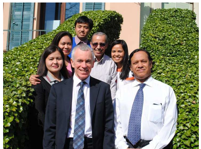
Délégation des Philippines et les experts du SYGADE à l'occasion de la formation de formateur SYGADE 6 à Genève

Le projet a fait d'importants progrès : le SYGADE 6 est entièrement fonctionnel et la base de données consolidée du gouvernement est opérationnelle suite à la migration de la base de données des titres de créance vers le SYGADE 6 et à la mise en place des procédures de migration des données. Le projet étudie en outre l'acquisition d'un système de gestion de trésorerie et les liens entre les systèmes intégrés et le SYGADE. En matière de réforme de la structure organisationnelle et d'amélioration des fonctions de gestion des risques au BTr, le projet a conduit plusieurs études et a proposé des recommandations. Enfin, des terminaux Bloomberg ont été acquis pour le BTr afin d'améliorer le suivi et l'analyse en temps réel des informations sur le marché financier et l'utilisation de sa plateforme électronique de commerce.