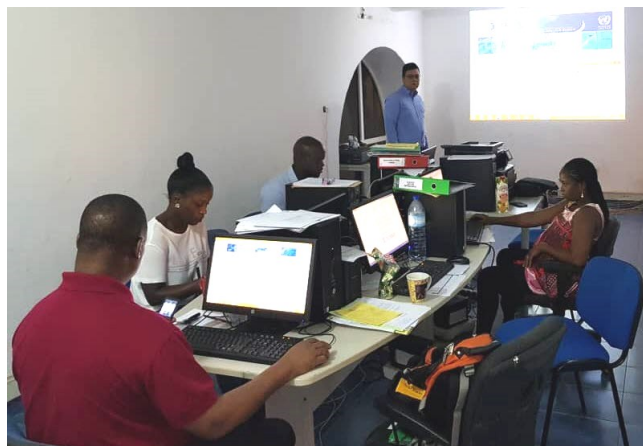
Formation SYGADE spécialisée, août 2018, Bissau

fin de l'année compléteront les connaissances et les efforts déployés à ce jour pour améliorer les opérations liées à la gestion de la base de données de la dette du SYGADE.