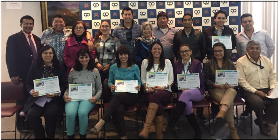
Formation fonctionnelle avancée à Quito, juin 2018

Les deux bases de données ont été converties du SYGADE 5.3 au SYGADE 6 et 35 utilisateurs des deux institutions ont été formés à l'utilisation du système (formation de base et avancée). Depuis la fin du projet précédent en 2007, d'importants changements organisationnels et professionnels ont eu lieu. Par conséquent, le ministère a jugé qu'une validation approfondie des données était nécessaire et s'est déroulée après la formation avancée avec le soutien d'un consultant SYGADE. Enfin, le MEF a demandé de nouvelles activités de renforcement des capacités sur les statistiques de la dette et sur l'analyse de portefeuille, afin que le nouveau personnel puisse être formé. La CNUCED poursuit la coopération avec la BC et le MEF, au-delà du projet.