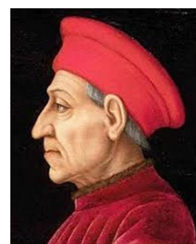
Cosimo de' Medici, Fondateur de la banque Médicis

“ banca dont le sens littéral était le «banc» où les changeurs d'argent avaient traité leurs affaires.”