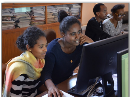
Participants à la formation fonctionnelle avancée

L'Érythrée est le dernier pays à avoir adopté la version 6 du SYGADE. Le ministère des Finances (Mdf) a récemment terminé l'enregistrement de sa base de données sur la dette du gouvernement.