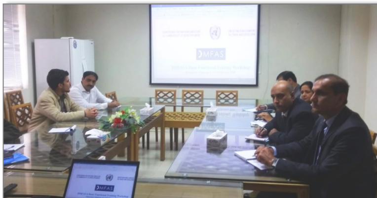
Entrenamiento básico en Islamabad, enero-febrero de 2019

El proyecto también prevé una actividad relacionada con la generación de órdenes de pago automatizadas desde el sistema. Concluirá con capacitación en validación de datos de deuda que fortalecerá aún más la capacidad general del gobierno para integrar controles de calidad de datos de la deuda en el proceso de registro y verificación de la oficina de deuda. Esto dará como resultado una información más confiable para fines estadísticos y analíticos. Financiado por el Banco Mundial, el proyecto, que comenzó a fines de 2018, finalizará en junio de 2019.