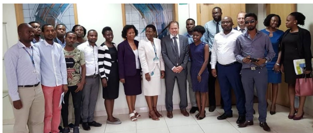
Expertos de la deuda de Etiopía y de Uganda con los expertos del SIGADE, Kampala, marzo de 2019

Esta capacitación ayuda a los países a comprender los referidos estándares, a definir mejor el contenido, la presentación y la frecuencia de sus datos estadísticos de deuda, y asiste a los oficiales de deuda a producir y seleccionar los cuadros estadísticos apropiados (dentro del SIGADE) y los períodos de presentación de informes de sus propios boletines estadísticos de deuda.