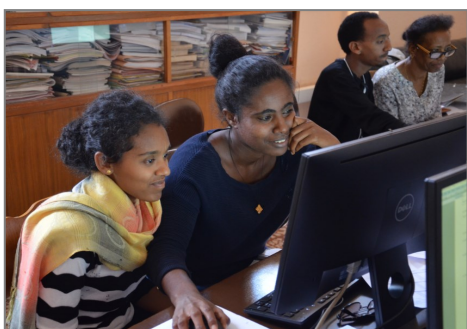
Participantes en el entrenamiento funcional avanzado.

Eritrea es el último país en adoptar el SIGADE 6. El Ministerio de Finanzas (Ministerio de Finanzas) ha completado recientemente el registro de pasivos del gobierno en su base de datos.