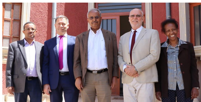
S.E. Sr. Berhane Habtemariam, Ministro de Finanzas de Eritrea (centro) con los expertos del SIGADE, el Coordinador de la Unidad de PFM y el Director General del Tesoro

Tanto el Ministro de Finanzas como el representante del BAD que supervisó este proyecto felicitaron a las partes interesadas en la implementación del proyecto por los resultados alcanzados hasta el momento.