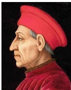
Cosimo de' Medici, Fundador de la banca Medici

Como reflexión final, es interesante observar el origen de la palabra "banco" que se deriva de la banca italiana. El significado literal de banca era el "banco" donde los cambiadores de dinero solían realizar transacciones comerciales. El término fue utilizado más tarde para describir el establecimiento en sí. ¡Banca rotta (de la cual obtuvimos el término "banarrota") es simplemente un banco roto.