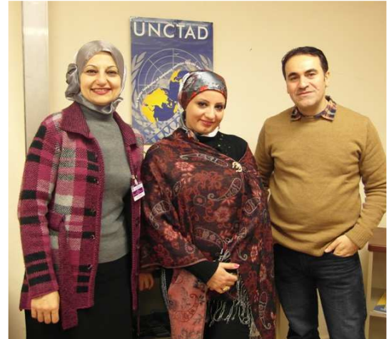
Délégation du ministère des finances d'Iraq

Début décembre 2012, une délégation iraquienne est venue à Genève pour la première activité du projet, la conversion de la base de données au format SYGADE 6.0 et la formation technique à l'installation du système. Cette activité a eu pour résultat l'installation réussie en janvier 2013 du système dans les locaux du ministère des finances à Bagdad, permettant aux utilisateurs de commencer à pratiquer sur le nouveau système. A l'issue de cette première expérience, l'atelier de formation fonctionnelle de base se déroulera à Amman au cours du second trimestre 2013.