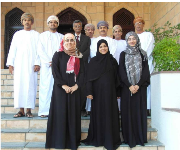
Experts du Département des emprunts, Sultanat d'Oman

En octobre 2012 ont été conduites les deux dernières activités du projet renforcement des capacités en matière de gestion de la dette publique à Oman. Ces activités, l'atelier sur les statistiques de la dette et l'évaluation finale du projet, ont été organisées conjointement avec le Département des emprunts du Ministère des finances. Le résultat de l'atelier sur les statistiques a été la production d'un projet de bulletin statistique de la dette qui servira de base à la publication du premier bulletin prévue pour la fin du premier trimestre 2013.