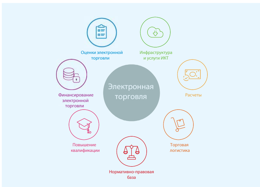
Диаграмма 2. Семь областей политики инициативы «Электронная торговля для всех»

Чтобы не допустить того, чтобы развитие цифровой экономики вело к расширению цифрового разрыва и усилению имущественного неравенства, а также для обеспечения того, чтобы большее число людей и предприятий в развивающихся странах имели возможность реально участвовать в ней, международному сообществу необходимо будет расширить свою поддержку в массовом масштабе. Нынешний уровень поддержки неудовлетворителен. Так, доля ИКТ в общей помощи в интересах торговли сократилась с 3% в 2002–2005 годах до 1,2% в 2015 году. Поэтому необходимы активные усилия. Один из способов получить отдачу от имеющихся знаний и максимизировать синергизмы с партнерами по развитию – использование платформы ЮНКТАД «Электронная торговля всех» (диаграмма 2). ЮНКТАД также приступила к