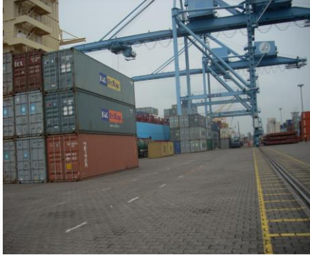
PORT AUTONOME DE KRIBI