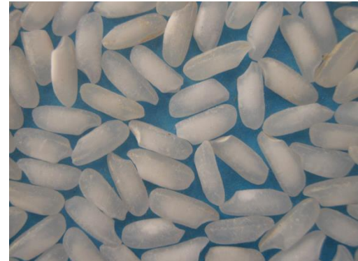
Rojofotsy (paddy, riz cargo, riz usiné)