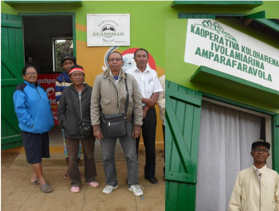
Quelques membres de la Coopérative Koloharena

Cas du riz rose de Madagascar Expérience de la Coopérative KOLOHARENA