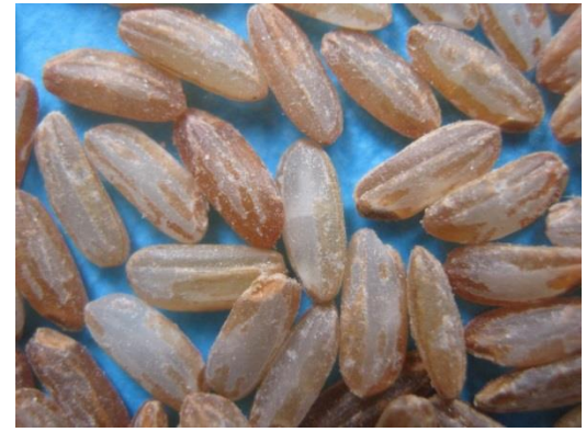
Vary Malady (paddy, riz cargo, riz usiné)