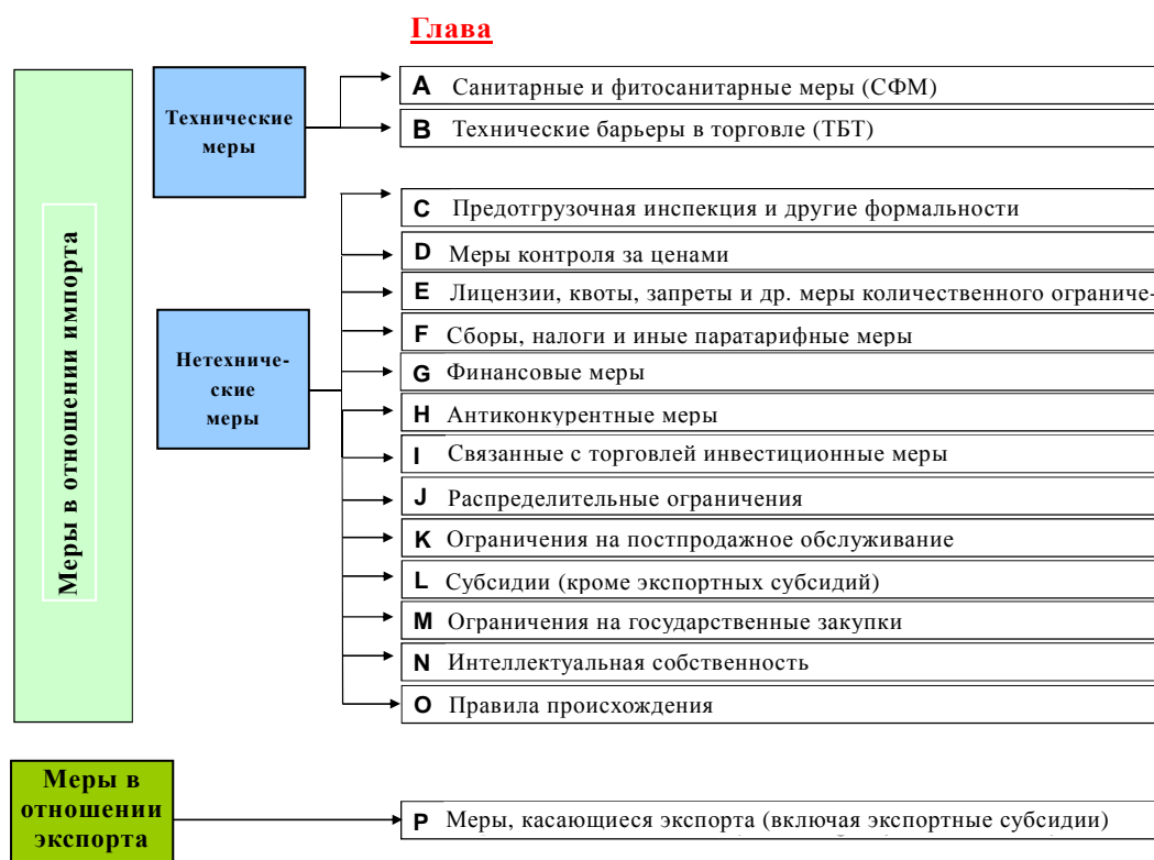
Диаграмма 1 Система классификации НТМ

тему их классификации (они были разработаны ЮНКТАД совместно с ВТО, см. диаграмму 1) 12 . Было предложено следующее определение НТМ: "К нетарифным мерам (НТМ) относятся меры политики, которые не являются таможенными тарифами и которые могут оказывать экономическое воздействие на международную торговлю товарами, изменяя либо объемы торговли, либо уровень цен, либо и то и другое".