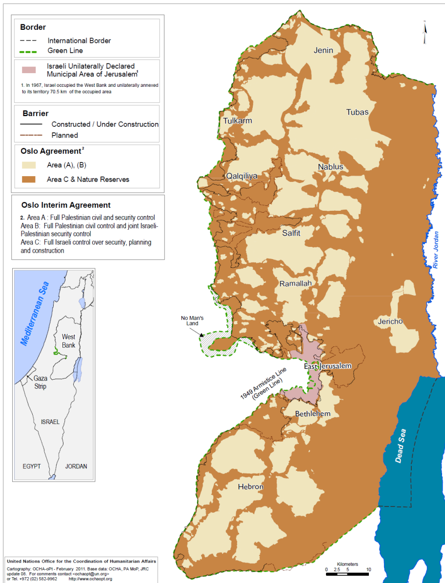
Figure 1 Carte de la zone C