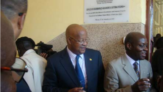
M. Carlos Gomes - Premier Ministre (au centre) et M. José Mário Vaz – Ministre des Finances

Le Gouvernement de Guinée Bissau a entrepris depuis 2009 une réforme douanière comprenant la modernisation du système informatique douanier. La migration de l'ancien système a permis la création d'un prototype national, l'adoption de documents et de procédures modernisés, la mise en place des infrastructures informatiques, de communication et de réseaux, ainsi que la formation du personnel des douanes, déclarants, agences maritimes et Trésor Public.