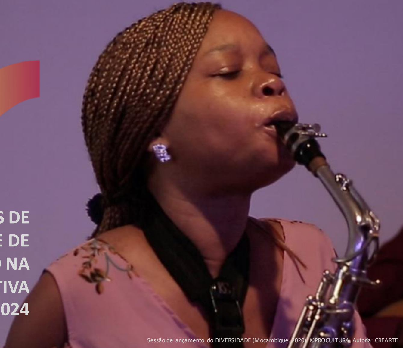
Sessão de lançamento do DIVERSIDADE (Moçambique, 2020)