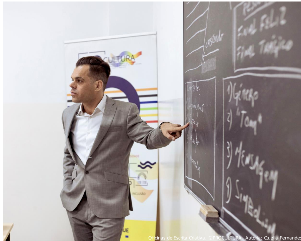
Oficinas de Escrita Criativa. ©PROCULTURA. Autoria: Queila Fernandes