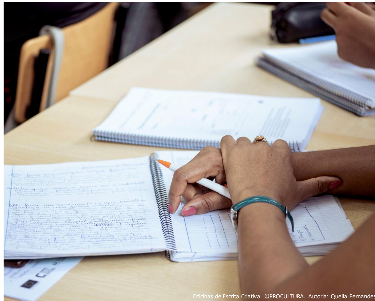
Oficinas de Escrita Criativa.