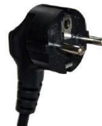
Type F: This will NOT fit

Veuillez apporter votre propre adaptateur car la CNUCED n'en fournit pas.