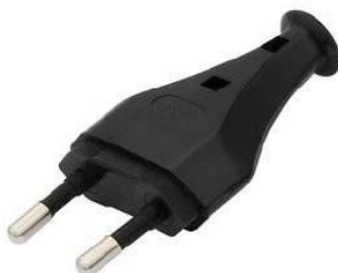
Type C: This will fit