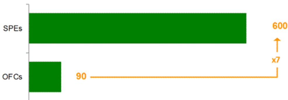
Диаграмма 3 - Оценка притока инвестиций в СФС a и ОФЦ в 2011 году (млрд. долл. США)