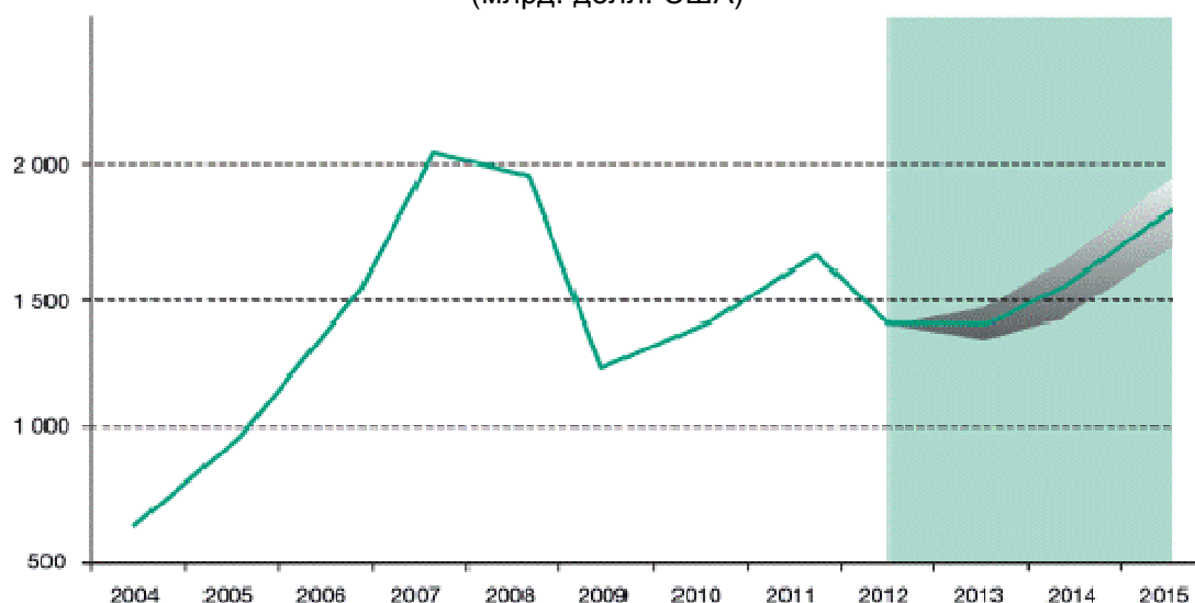
Диаграмма 1 -Глобальные потоки ПИИ в 2004–2012 годах и прогнозы на 2013–2015 годы (млрд. долл. США)