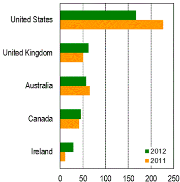
Диаграмма 1 - Пятерка крупнейших получателей новых ПИИ в развитых странах, 2011 и 2012 годы (млрд. долл. США)