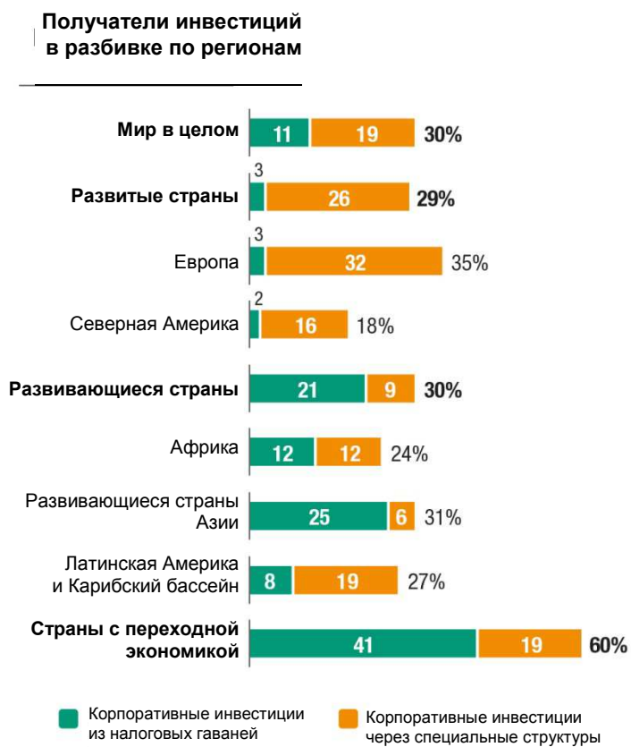
Диаграмма 2 -Доля инвестиций, ввезенных из оффшорных хабов, в общем объеме накопленных корпоративных инвестиций, 2012 год