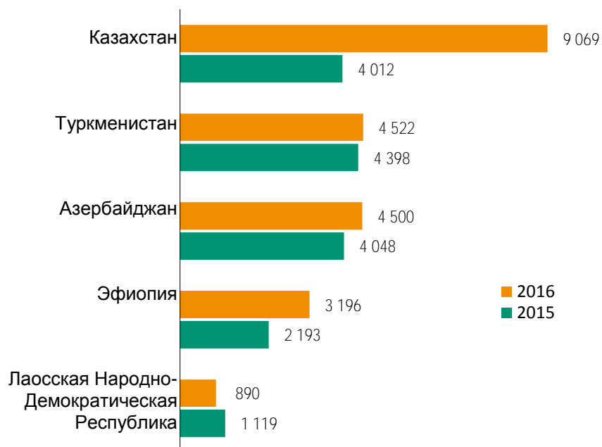
Диаграмма 2: НВМРС: Пять крупнейших получателей ПИИ в 2015–2016 годах (В миллионах долларов)