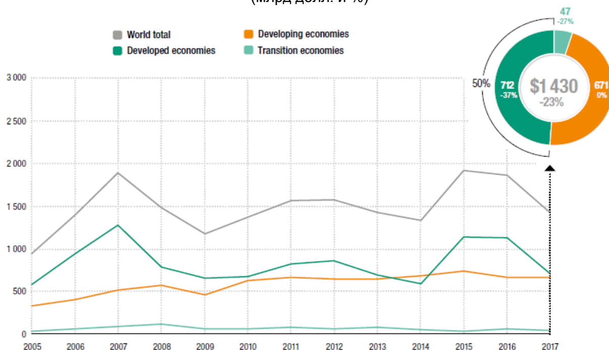
Диаграмма 1: Приток прямых иностранных инвестиций во всем мире и по группам стран в 2005–2017 годах (млрд долл. и %)