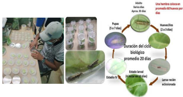
Ciclo biológico de la polilla dorso diamante ( Plutella sp. )

Determinación del ciclo biológico de plagas, determinación del rendimiento de cultivares de papa y tomate y evaluación de bioinsecticidas (extractos de vegetales).