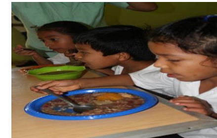
Frijol-poroto biofortificado IDIAP NUA 24, IDIAP P1338 e IDIAP P-0911, viabilidad de uso en la alimentación.