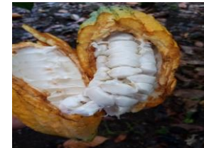
Clon de cacao Idiap AS- CP 26 - 61 mulato

Evaluación de secadora solar artesanal, fermentadoras artesanales, evaluación y caracterización morfológica de ocho genotipo de cacaos criollos y estudios de curva de estrés hídrico.