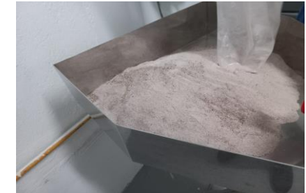
Validación del procesamiento - desarrollo de subproductos en camote