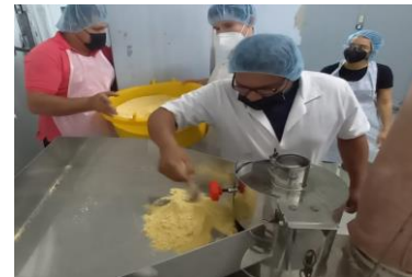
MAÍZ BIOFORTIFICADO IDIAP MQ 18 e IDIAP MQ 09

Generar alternativas tecnológicas nutricionales que permitan el uso de los cultivos biofortificados en la alimentación humana.