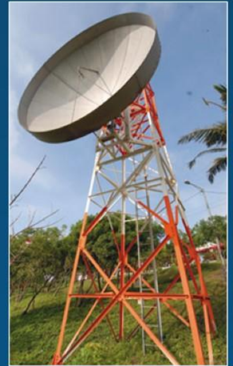
Servicios de Telecomunicaciones