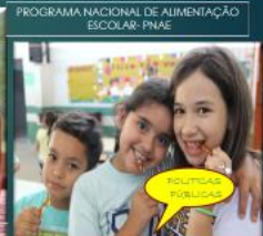
PROGRAMA NACIONAL DE ALIMENTAÇÃO ESCOLAR- PNAE