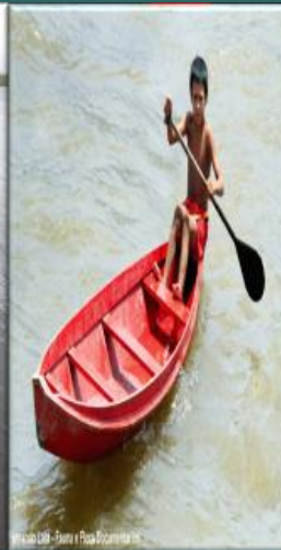
IMAGENS QUE NÃO TEM PREÇO!!!!!!!