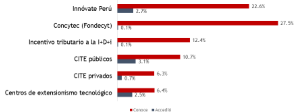
Empresas que conocen los programas y servicios de apoyo a la innovación, 2015-2017

Fuente: Encuesta Nacional de Innovación en la Industria Manufacturera y Empresas de Servicios Intermedias en Conocimiento, 2018 Elaboración: OGEIE-PRODUCE