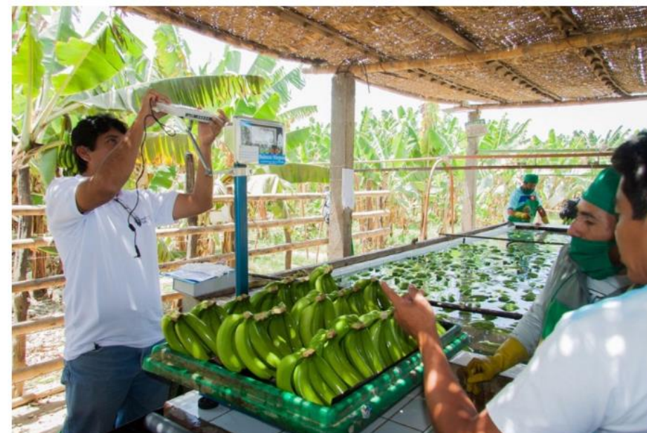
Proyecto de innovación productiva.

Se trata del más grande en la historia del país, a través del programa ProInnovate.