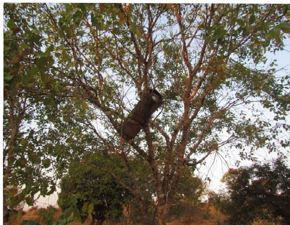
Produção tradicional (cortiços)