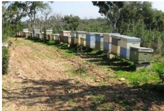
Produção moderna (apiários com colmeias)