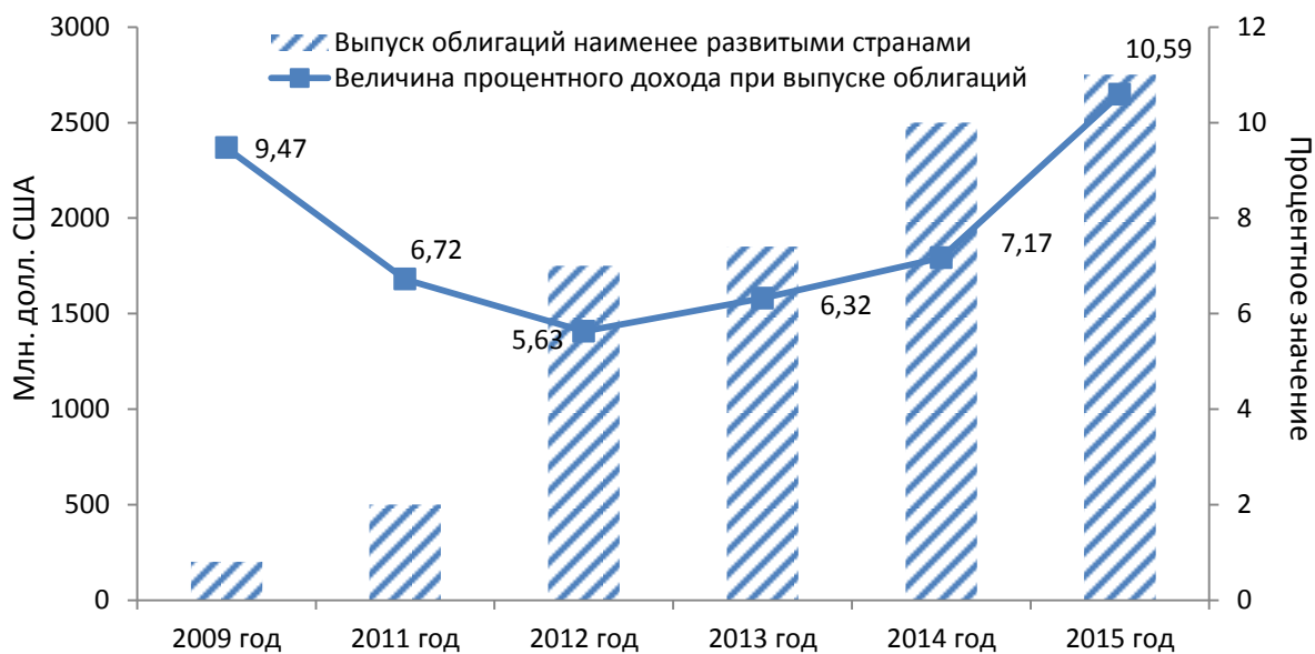
Рисунок I Выпуск международных суверенных облигаций наименее развитыми странами (2009–2015 годы)