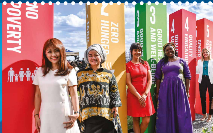
Campeonas de la participación de las mujeres en la tecnología y el comercio electrónico

Nuestros centros de excelencia reúnen varias redes para el fomento de la capacidad en África y Asia. En 2019 pasaron a ser cinco, con la adición de tres nuevos centros: el Instituto Universitario Europeo de Florencia (Italia); el Ministerio de Economía Oceánica, Recursos Marinos, Pesca y Transporte Marítimo de Mauricio; y el Centro para el Estudio de las Economías de África en Nigeria. Los cursos elaborados e impartidos en esos centros fomentan el intercambio de experiencias, prácticas óptimas y conocimientos entre responsables de las políticas y expertos de varios países.