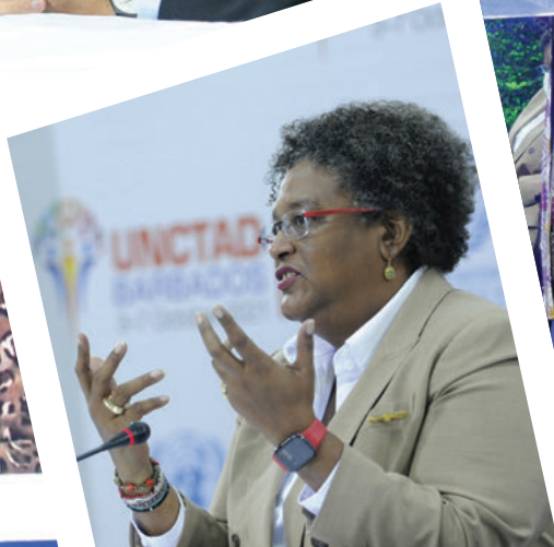
World Leaders Summit, Dialogue 3