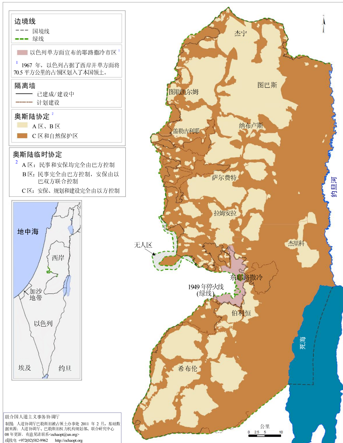
图 1 C 区地图

资料来源：人道协调厅， www.ochaopt.org/documents/ocha_opt_area_c_map_2011_02_22.pdf (访问日期：2014 年 6 月 27 日)。