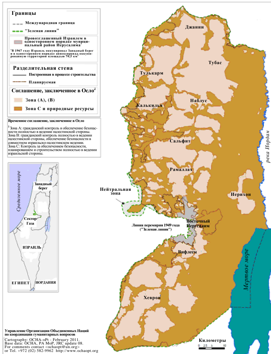
Рис. 1 Карта зоны С