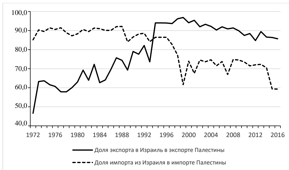
Диаграмма 2 Доля Израиля в палестинской внешней торговле (в процентах)