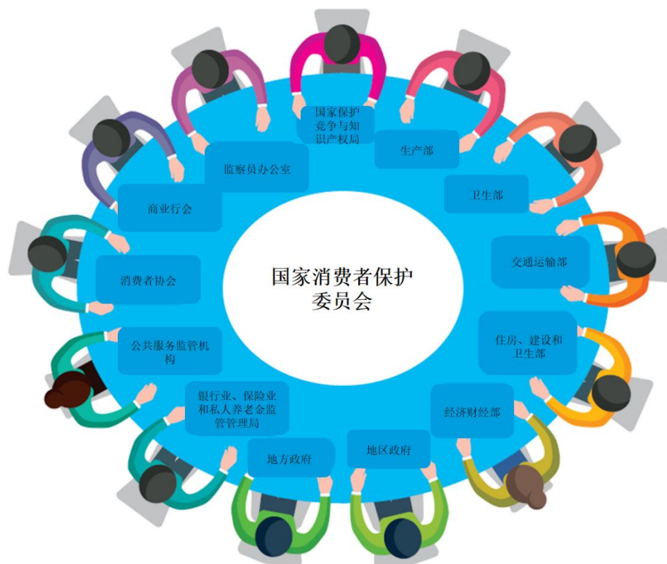
图 3 国家消费者保护委员会成员