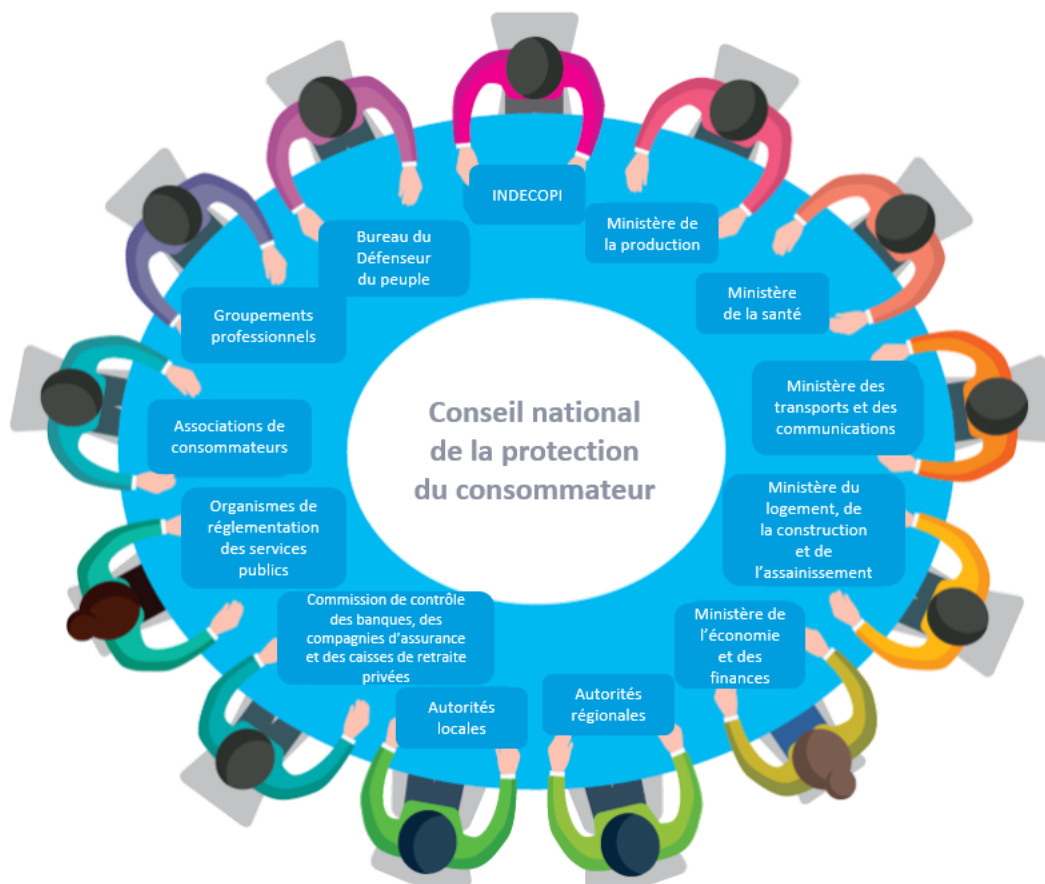
Figure 3 Membres du Conseil national de la protection du consommateur